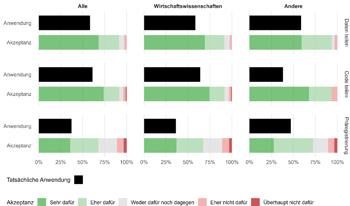
Abbildung 1: Anwendung und Akzeptanz von Open-Science-Praktiken

Abbildung 2 vergleicht die tatsächliche Nutzung von Open-Science-Praktiken mit den Wahrnehmungen der Forschenden darüber, wie verbreitet diese Praktiken in ihrem jeweiligen Fachgebiet sind. In jedem Panel zeigt der obere Balken den Anteil der Wissenschaftler:innen in einer bestimmten Disziplin, die berichten, eine bestimmte Open-Science-Praxis mindestens einmal angewendet zu haben; der darunterliegende Balken gibt die durchschnittlichen Einschätzungen der Befragten darüber wieder, welcher Anteil der Forschenden in ihrem Fachgebiet dies getan hat. Das linke Panel fasst die Ergebnisse für alle Befragten zusammen, das mittlere Panel konzentriert sich auf die Antworten von Ökonom:innen und das rechte Panel zeigt die Antworten von Nicht-Ökonom:innen. Die Daten zeigen, dass Open Science Techniken sehr viel verbreiteter sind als es von den Forschenden wahrgenommen wird.